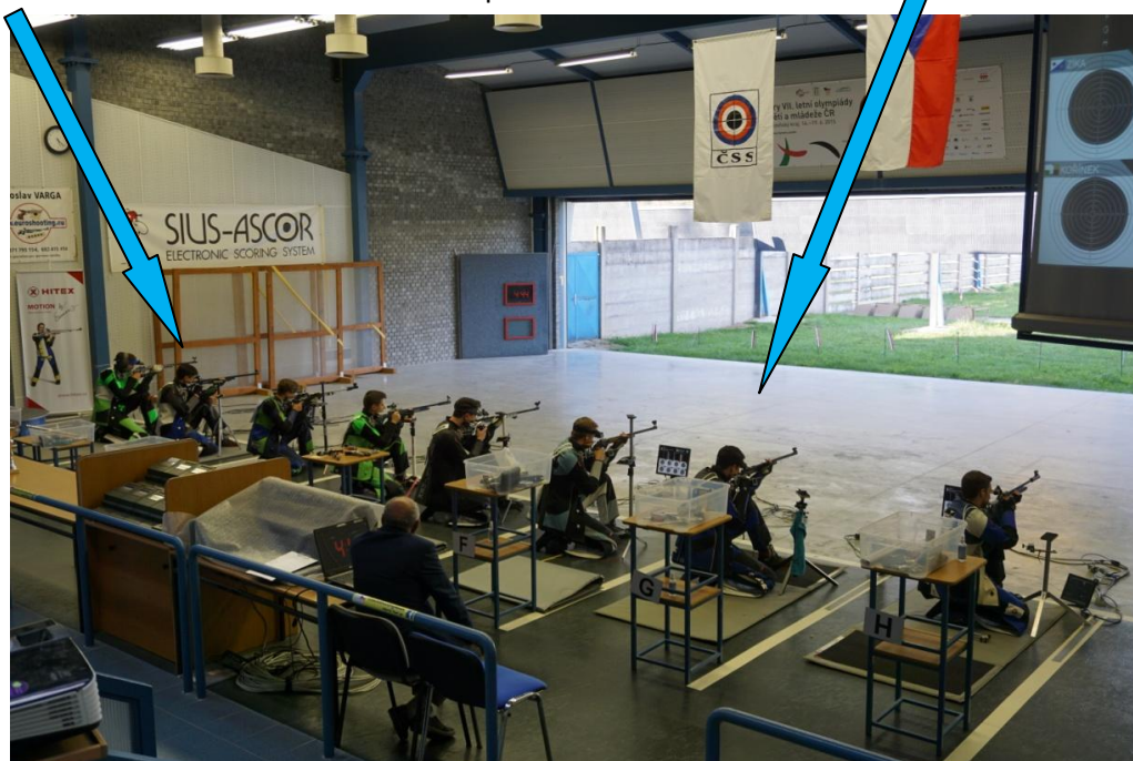
Dva Patrioti ve finále juniorů v disciplíně 3x40 ran.